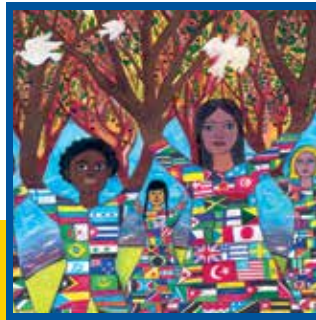
"Barış Afışı Yarışması"