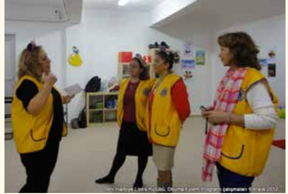
Yeni Harbiye Lions Kulübü, Okuma Eylem Programı çalışmaları 1 Aralık 2012

Oyunları, bilmeceleri, bilimi ve masalları öğrenebilmek için kitaplardan nasıl faydalandığımızı ifade eden "Küçük Prens, Söyle Bana" isimli drama, "Küçük Prens" in öyküsü eşliğinde çocuklarla birlikte gerçekleştirildi. Kitapları kolayca okuyabilmemizde Atatürk Harf Devrimi'nin rolünü vurgulayan kitap ayıraçları dağıtıldı.