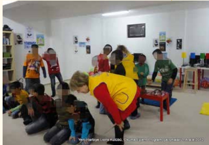
Yeni Harbiye Lions Kulübü, Okuma Eylem Programı çalışmaları 1 Aralık 2012

Bir Pazar gününün kimsesiz çocuklarla birlikte mutluluk içinde geçirildiği bu etkinliğe çok sayıda Lion arkadaşımız katılarak bizi destekledi. Ortamın