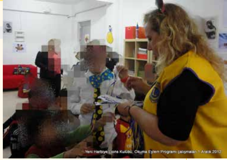
Yeni Harbiye Lions Kulübü, Okuma Eylem Programı çalışmaları 1 Aralık 2012

Kitap vermek kadar, kitabı okumaya da teşvik etmek amacı ile 1 Aralık 2012 tarihinde çocuk yuvasında bir okuma şenliği düzenlendi. Lion olmayan, fakat konuya ilgi duyan dört arkadaşımızın da dahil edildiği projede, etkinlik içerik tamamen bir tiyatro oyunu şeklinde düzenlendi.