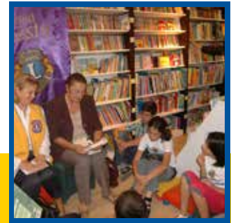
Bir Çocuk Değişir, Dünya Değişir