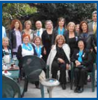
Yaşam Beceriler Programı Değerlendirme Süreci ve Önemi