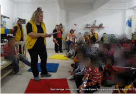
Yeni Harbiye Lions Kulübü, Okuma Eylem Programı çalışmaları 1 Aralık 2012

Bu birliktelik, verilen hizmetin mutluluğa dönüştüğü bir zaman dilimi olarak belleklerimizde ve yüreklerimizde yerleşti.